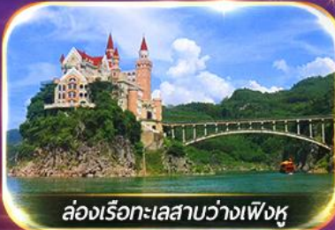
ล่องเรือทะเลสาบว่างเฟิงหู