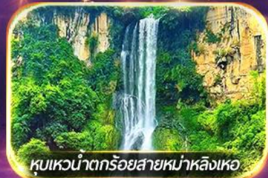
หุบเขาน้ำตกร้อยสายหม่าหลิงเหอ

ชมวิถีชีวิตหมู่บ้านปู้อี้ยามค่ำคืน, ล่องเรือทะเลสาบว่างเฟิงหู ชมสวนดอกไม้ตามฤดูกาล, ซอปปิ้งจูงใจถนนคนเดิน