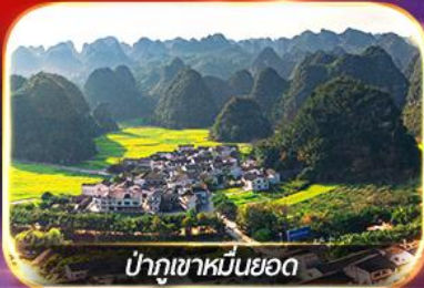
ป่าภูเขาหมื่นยอด