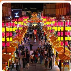
ตลาดกลางคีนซาโจว