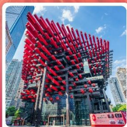
ตึกตะเกียบ