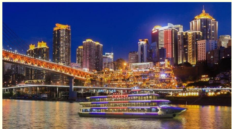
Option เสริม ล่องเรือราตรีชมแม่น้ำสองสาย

*ราคาทัวร์นี้ยังไม่รวมค่าบริการค่าล่องเรือ สำหรับท่านที่สนใจจะมีค่าบริการท่านละ 300 หยวน (ราคาอาจมีการเปลี่ยนแปลง กรุณาตรวจสอบราคาก่อนซื้ออีกครั้ง)*