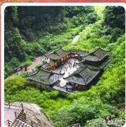
หลุมบ่อฟ้า