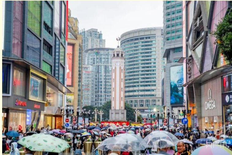
ถนนคนเดินเจี๋ยฟางเป่ย์

และนำท่านไป ถนนคนเดินเจี๋ยฟางเป่ย์ (Jiefangbei Street) ตั้งอยู่บริเวณอนุสาวรีย์ปลดแอก ซึ่งสร้างขึ้นเพื่อรำลึกถึงชัยชนะในการทำสงครามกับญี่ปุ่น แต่ปัจจุบันกลายเป็นศูนย์กลางทางการค้าขนาดใหญ่ ใจกลางเมือง เต็มไปด้วยร้านค้ามากกว่า 3,000 ร้าน ซึ่งมีทั้งอาหาร ซ้อปิ้ง มอลล์ขนาดใหญ่ ให้ท่านได้เดินชมและซ้อปิ้งกันอย่างจุใจ.