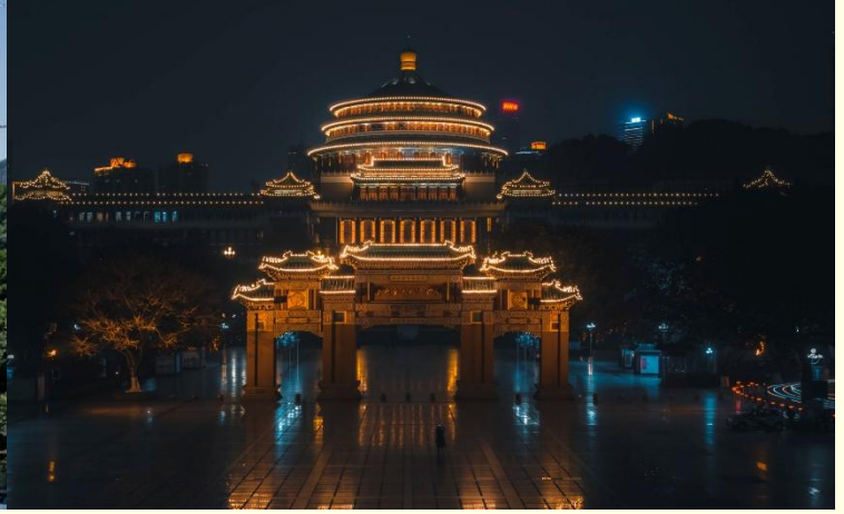
ศาลาประชาชน