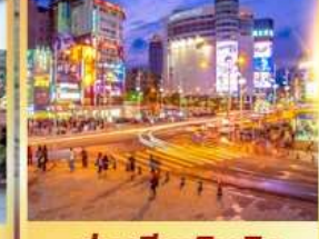
ย่านซีเหมินติง