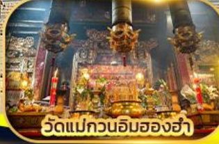
วัดแม่กวนอิมสองอ่า