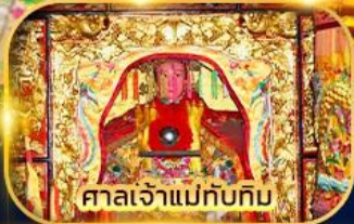
ศาลเจ้าแม่ทับทิม