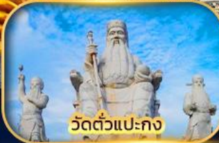
วัดตัวแปะกง