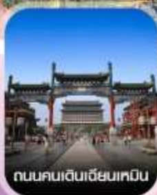
ถนนคนเดินเฉียนเหมิน

✈️ คอนเฟิร์มออกเดินทาง ทุกพีเรียด 2 ท่านขึ้นไป