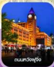
ถนนหวงฟู่จิ่ง