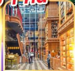
ร้านไอศกรีมมियाฮาร่า