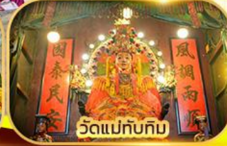
วัดแม่ทับทิม