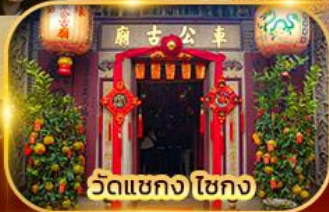
วัดเขกง ไชกง