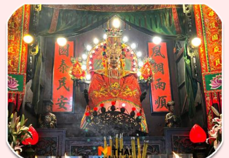
นางฟ้าพามู

จากนั้นเดินทางไปต่อที่ วัดทินหัว (วัดเจ้าแม่ทับทิม) เป็นวัดเก่าแก่ในฮ่องกง สมัยก่อนฮ่องกงเป็นหมู่บ้านชาวประมง ซึ่งคนจะให้ความเคารพนับถือเจ้าแม่ทับทิมทินหัวเป็นอย่างมาก เพราะเชื่อว่าเป็น เทพีแห่งท้อง