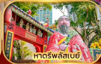
หาดร์พลัสเบย์