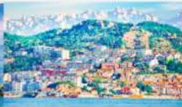
หมู่บ้านชาวประมงซาจื่อโข่ว