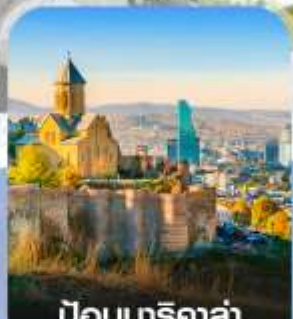
ป้อมนาร์คาล่า