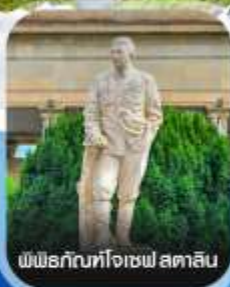
พิพิธภัณฑ์โจเซฟ สตาลิน