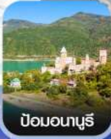
ป้อมอนาบุรี