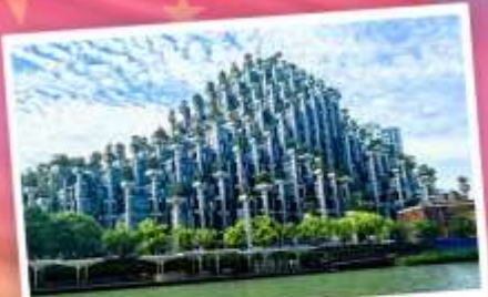
ต้นไม้พันต้น