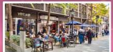
ชิวเกียนตี้