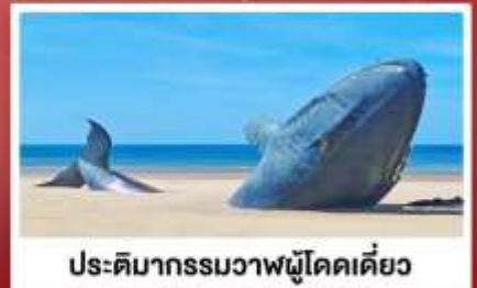
ประติมากรรมวาฬผู้โดดเดี่ยว