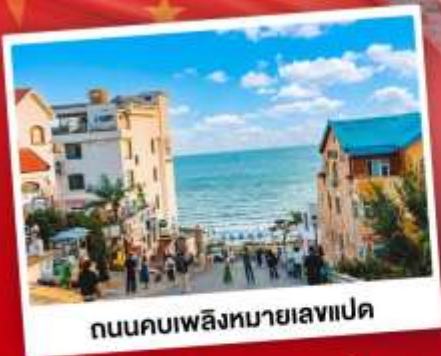
ถนนคอปเปลิงหมายเลขแปด