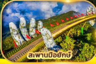
สะพานมือยักษ์