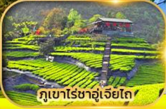
ภูเขาไร้อาฮูเจียโก