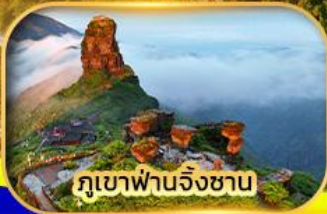
ภูเขาฟานจิ้งชาน