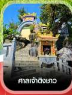
ศาลเจ้าดังขาว