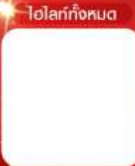
โพลาร์ทิงทอม