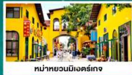
หม่าหยวนมีเออร์เกง