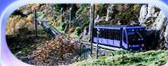
นั่งรถรางขึ้นยอดเขาฟลอยอน

เปิดประสบการณ์สุดว้าว... สักครั้งในชีวิต! ล่องเรือชมฟยอร์ด