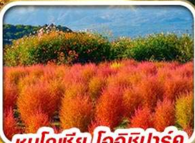
ชมโคเชีย โออิชิปาร์ค