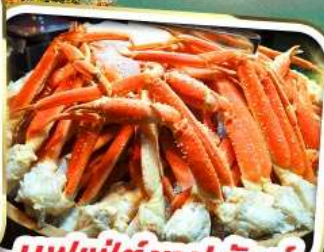
บุฟเฟ่ต์ซาปูยักษ์