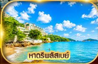
หาดริพลัสเบย์