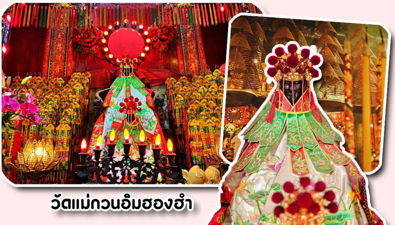
วัดแม่กวนอิมฮ่องกง

พาท่านเดินทางไปไหว้ขอพรขอเงิน วัดแม่กวนอิมฮ่องกง วัดเก่าแก่ของฮ่องกงสร้างตั้งแต่ปี ค.ศ. 1873 เป็นวัดขนาดเล็กที่มีชาวฮ่องกงศรัทธาแน่นถือกันเป็นอย่างมาก วัดแห่งนี้เป็นที่ประดิษฐาน องค์เจ้าแม่ กวนอิมฮ่องกง ที่มีชื่อเสียงเรื่องการให้กู้ยืมเงิน เชื่อกันว่าท่านช่วยพลิกฟื้นเศรษฐกิจของชาวฮ่องกง ผู้คนจึงนิยมมายืม เงินทำธุรกิจจนสำเร็จร่ำรวย รุ่งเรือง โดยให้ท่านอธิษฐานขอพรต่อหน้าเจ้าแม่กวนอิมฮ่องกง พร้อมกับระบุวันเวลาในการ ขอพรด้วย จากนั้นนำธูปธูปตามฐานะและศรัทธาที่เราจะนำเป็นสื่อในการขอพร เขียนจำนวนเงินที่ต้องการลงไปด้วย ใ สกุลงเงินยี่งดีใหญ่ แล้วนำเงินใส่ในซองแดง ควรเตรียมซองแดงไปเอง นำซองแดงไปวนรอบกระถางธูป วนขวาจำนวน 3 ครั้ง แล้วเก็บซองแดงในกระเป๋าสตางค์ เป็นเงินขวัญถุง ถ้าประสบผลสำเร็จตามที่มุ่งหวัง ให้นำเงินในซองแดงทำบุญ หยอดตู้ที่วัดแห่งนี้ในโอกาสต่อไป วิธีไหว้ให้ปัง ให้ได้โชคลาภเงินทอง ต้องไปกับเราเท่านั้น