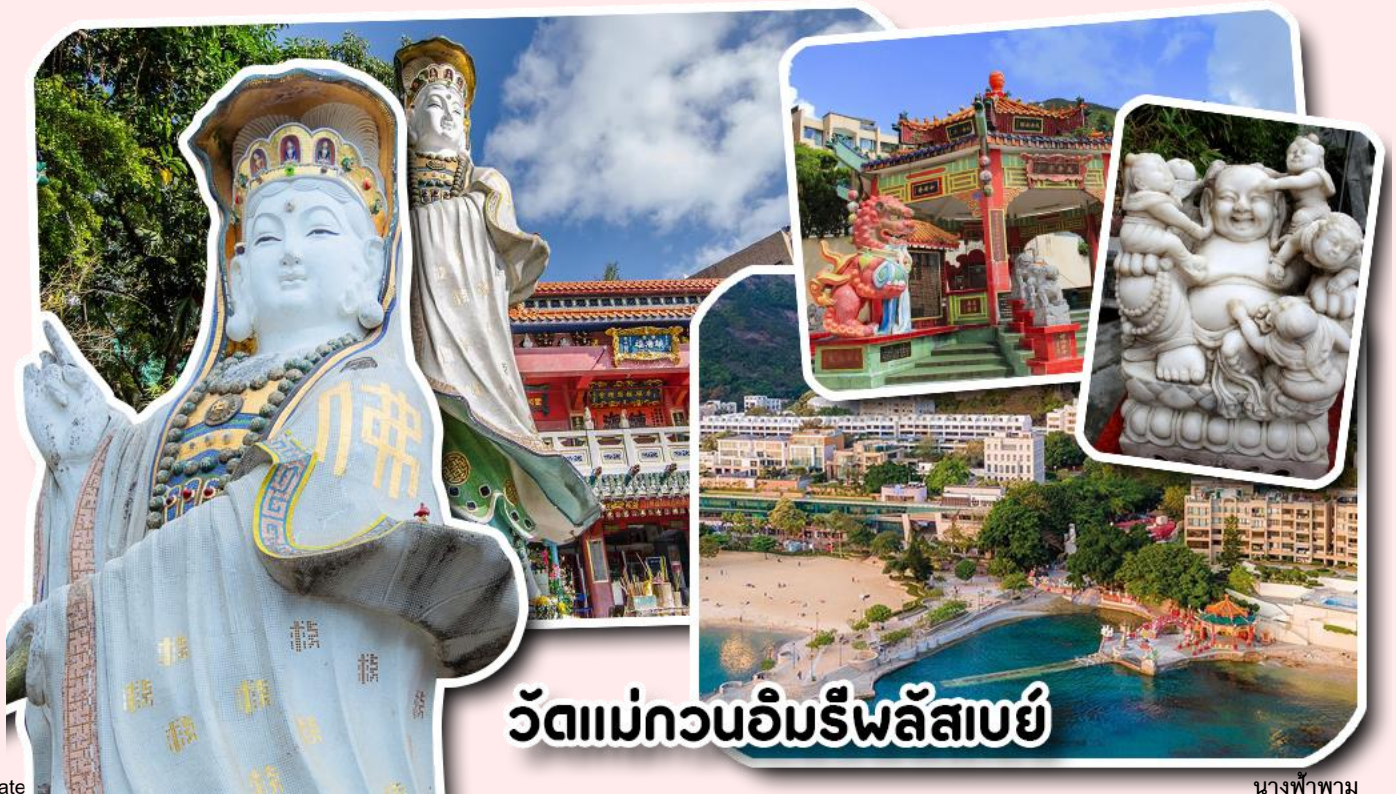
วัดแม่กวนอิมริพลัสเบย์

จากนั้นพาท่านเดินทางไปนมัสการ เจ้าแม่กวนอิมริมหาดริพลัสเบย์ วัดแห่งนี้ถูกสร้างขึ้นเพื่อคุ้มครองชาวประมงเวลาออกเรือไปหาปลาในสมัยก่อน บริเวณวัดมีสิ่งศักดิ์สิทธิ์มากมาย ได้แก่ เจ้าแม่กวนอิม ประดิษฐานอยู่ทางด้านซ้ายของวัด ซึ่งผู้คนนิยมเดินทางไปกราบไหว้ขอพรเรื่องการมีบุตร และยังมีพระสังกัจจายที่เชื่อกันว่าสามารถขอเพศของบุตรที่จะมาเกิดได้ โดยหลังจากกราบไหว้แล้วก็ให้ลูบที่ท้องของพระสังกัจจาย ถ้าอยากได้ลูกชายให้ลูบท้องซ้าย อยากได้ลูกสาวให้ลูบท้องขวา ถัดมาคือ เจ้าแม่ทับทิมเทพีแห่งท้องทะเล ท่านจะคอยคุ้มครองผู้เดินทางทางเรือ หรือผู้ที่เดินทางไปไหนมาไหนท่านจะคอยคุ้มครองให้ปลอดภัย และมีโชคลาภ ถัดจากบริเวณที่กราบไหว้ขอพร ก็จะมีศาลาแปดเหลี่ยมริมน้ำ และสะพานเล็กๆ ที่ชื่อว่าสะพานต่ออายุ ซึ่งเชื่อกันว่าหากเดินข้ามสะพานแห่งนี้ 1 ครั้ง ก็จะมีอายุยืนขึ้น 3 ปี