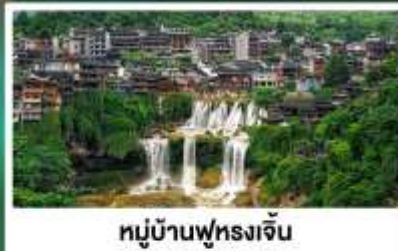
หมู่บ้านฟุหลงเจิน