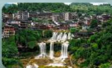
หมู่บ้านฟุทงเจิ้น