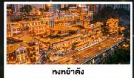
หงหย่าตั้ง