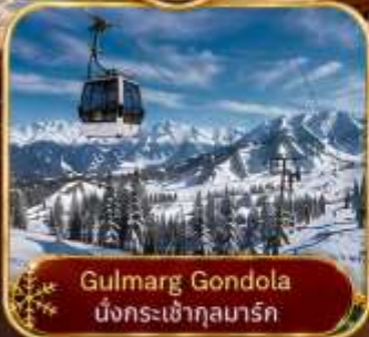
Gulmarg Gondola นั่งกระเช้ากุลมาร์ก

พักบ้านเรือ สไตล์โคโลเนียล สุดคลาสสิก 3 คืน