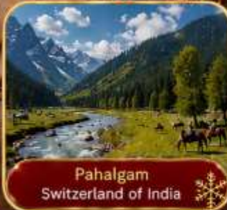
Pahalgam Switzerland of India