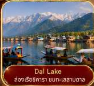
Dal Lake ล่องเรือชิวๆ ชมทะเลสาบดาล