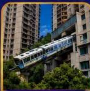
สถานีรถไฟฟ้าทะเลตุ๊ก