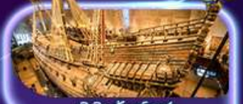
พิพิธภัณฑ์ทว่าซา