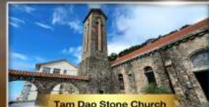
Tam Dao Stone Church