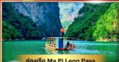
ส่องเรือ Ma Pi Leng Pass

เส้นทางเปิดใหม่ ซาฮายาง เช็คอินเมืองตามด้าว "เวียดนามฟีลยุโรป"