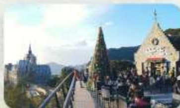
Gio Cafe Tam Dao