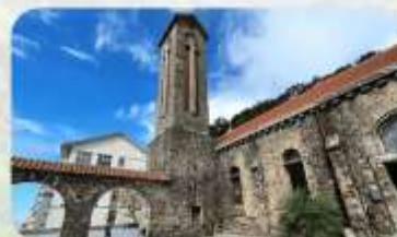
Tam Dao Stone Church