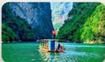
ล่องเรือ Ma Pi Leng Pass

YEN BIEN LUXURY 4* หรือเทียบเท่ามาตรฐานเวียดนาม