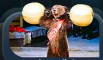
ชมละครสัตว์