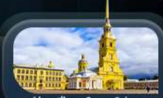
ป้อมปีเตอร์แอนด์ปอล

highlight สองเมืองไฮไลท์ของรัสเซียที่ไม่ควรพลาด! ตื่นตาตื่นใจกับมหาวิหารเซนต์บาซิล ชมความยิ่งใหญ่ของจัตุรัสแดง สัมผัสอดีตที่พระราชวังเครมลิน ชมความงามของสถานีรถไฟใต้ดิน มอสโก ชาร์กอร์ส โบสถ์ไอสิกริบดี เป็นเขาสเปร์โรว์ให้คุณได้สัมผัส ชมความงามพระราชวังฤดูหนาว พิพิธภัณฑ์เฮอร์มิเทจ ป้อมปีเตอร์แอนด์ปอล และมหาวิหารเซนต์ไอแซค