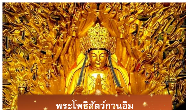
พระโพธิสัตว์กวนอิม

นำท่านเดินทางสู่ มรดกโลกอุทยานผาหินแกะสลักต้าจู้ ศิลปะหินแกะสลักอันล้ำค่าแห่งเมืองฉงชิ่งมรดกโลกที่องค์การยูเนสโกขึ้นทะเบียนเมื่อปี ค.ศ. 1999 ตั้งอยู่ทางตะวันตกของนครฉงชิ่ง ประเทศจีน ศิลปะหินแกะสลักเหล่านี้สร้างขึ้นตั้งแต่ราชวงศ์ถังจนถึงราชวงศ์ซ่ง มีอายุมากกว่า 1,000 ปี โดดเด่นด้วยงานแกะสลักทางพุทธศาสนาที่งดงามและยังคงสภาพสมบูรณ์ (ใช้เวลาเดินทางประมาณ 1-2 ชั่วโมง)